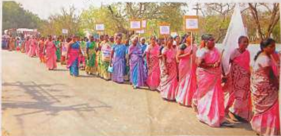
* உடனடி பெண்கள் தினத்தையொட்டி, அச்சிறப்புப்பாங்கத்திலும் பெண்கள் கல்வி வளர்ச்சி குறித்து விழிப்புணர்வு பதானகளை கையில் ஏந்தி ஊர்வலமாக சென்றனர்.