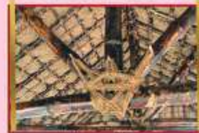
Truss fixing with 30% to 45% angle

10% முதல் 45% கத்தரி வடிவில் கழி வைத்து கட்டுதல்