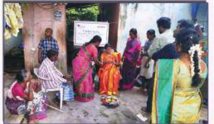
மாற்று திறனாளர் வளைகாப்பு விழா

மாற்றுத்திறனாளிகளின் பங்கேற்பை அனைத்து நிலைகளிலும் உறுதி செய்வதே இதன் முக்கிய நோக்கமாகும். மாற்றுத்திறனாளிகளை குறித்த சமூக கண்ணோட்டங்களை தகர்த்தல், சமுதாய சூழலை ஏற்று மாற்றுத்திறனாளிகளையும் சமூகத்தின் அங்கத்தினர்களாக மாற்றும். குடும்ப விழாக்கள், கிராம நிகழ்வுகள், கிராம சபை கூட்டங்களில் பங்கேற்பு, மாற்றுத்திறனாளிகளுக்கான அரசின் சட்டங்களின் மூலம் அவர்களது உரிமை மற்றும் சலுகைகளை மீட்டெடுத்தல், சமூகத்தின் மக்களிடம் மனிதநேய பண்புகளை வளர்த்தல், போன்ற செயல்பாடுகளைக் கொண்டு மாற்றுத்திறனாளிகளின் வாழ்வியல் நிலையை முன்னேற்றம் ஏற்படுத்தப்பட்டுள்ளது.