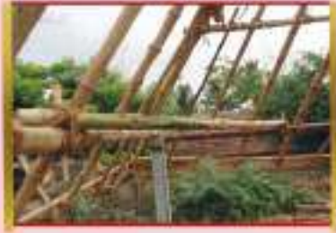
Fixing of cross bracing

சிமெண்ட் தூணுடன் சவுக்கு கழியை போல்ட் நடடுடன் இணைத்தல்