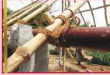
Use of casuarina pins and coir ropes