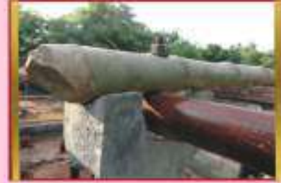
Beams anchored with pillar bolt

சிமெண்ட் தூணுடன் சவுக்கு கழியை போல்ட் நடடுடன் இணைத்தல்