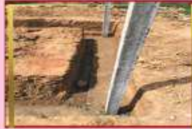
Plinth wall with RRM masonry & pillar footing