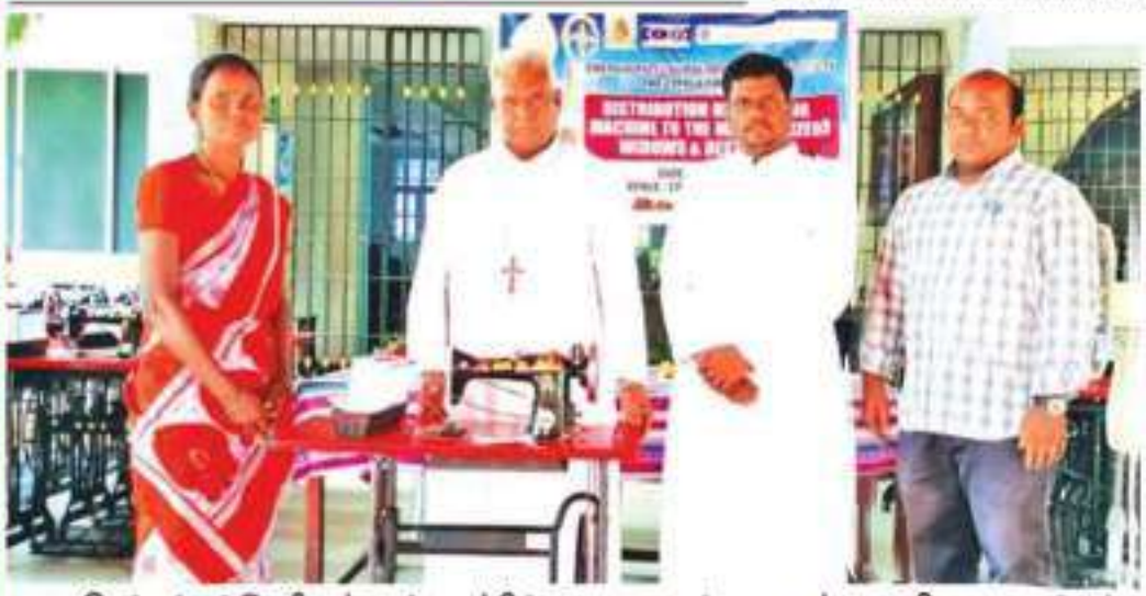
செங்கல்பட்டு சி.ஆர்.டி.எஸ் சார்பில் மறைமாவட்ட ஆயர் 50 விதவை மற்றும் மாற்றுத்திறனாளி பெண்களுக்கு ரூ.11 லட்சம் மதிப்பீட்டில் நலத்திட்டம் வழங்கியபோது எடுத்த படம்.