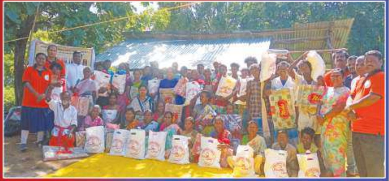
கோல்பிங் கிந்தியா கிறிஸ்து பிறப்பு விழா கொண்டாட்டம் - ஓரகடம் கிராமம்: